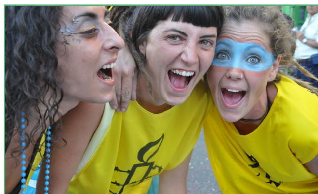
Pie de foto.